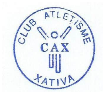
Club Atletisme Xativa

Consultas encaxativa@gmail.com en el Teléfono de la Organización 644255958.